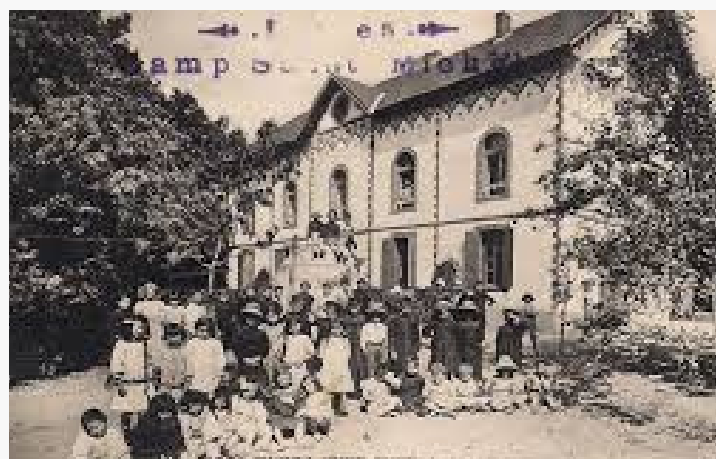
L'équipe de La Brise de Mer

Chacun profite d'un séjour sur mesure. Les membres de l'équipe sont à votre disposition durant votre séjour, N'hésitez pas à prendre contact en cas de besoin !